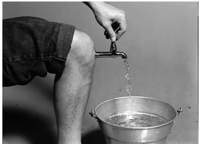
(Marcelo Zocchio e Everton Balladrin, O Pequeno Dicionário Ilustrado de Expressões Idiomáticas )