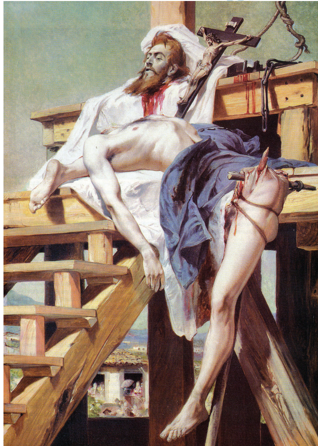
(Pedro Américo. Tiradentes esquartejado , 1893. Museu Mariano Procópio, Juiz de Fora.)

A conhecida pintura de Pedro Américo (1840-1905) remete a um fato histórico relacionado à seguinte escola literária brasileira: