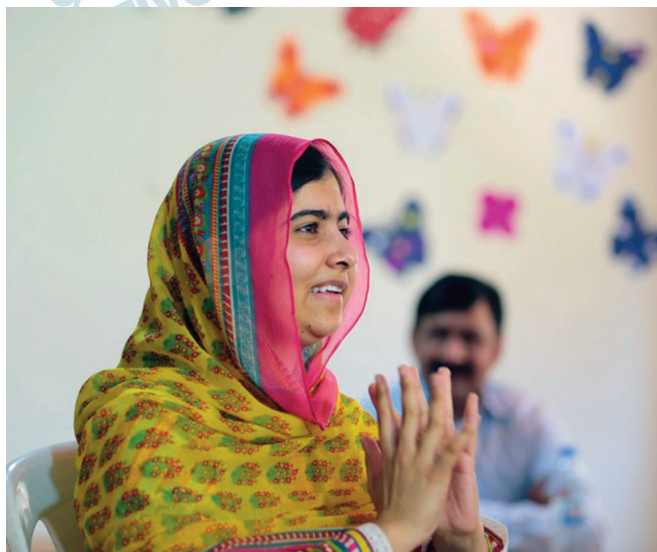
Nobel Peace Prize laureate Malala Yousafzai gestures inside a classroom at a school for Syrian refugee girls, July 12, 2015.

Malala Yousafzai, the youngest winner of the Nobel Peace Prize, celebrated her 18th birthday in Lebanon on Sunday by opening a school for Syrian refugee girls and called on world leaders to invest in “books not bullets”. Malala became a symbol of defiance after she was shot on a school bus in Pakistan in 2012 by the Taliban for advocating girls’ rights to education. She continued campaigning and won the Nobel in 2014.