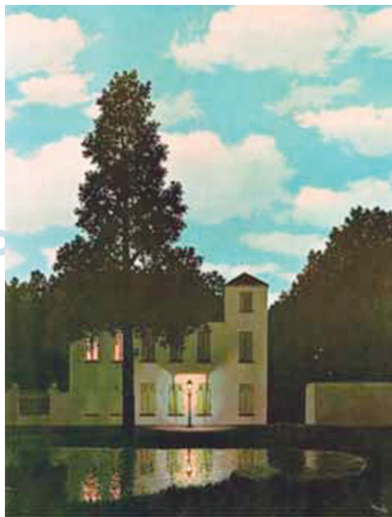
(René Magritte. Império das luzes , 1954.)