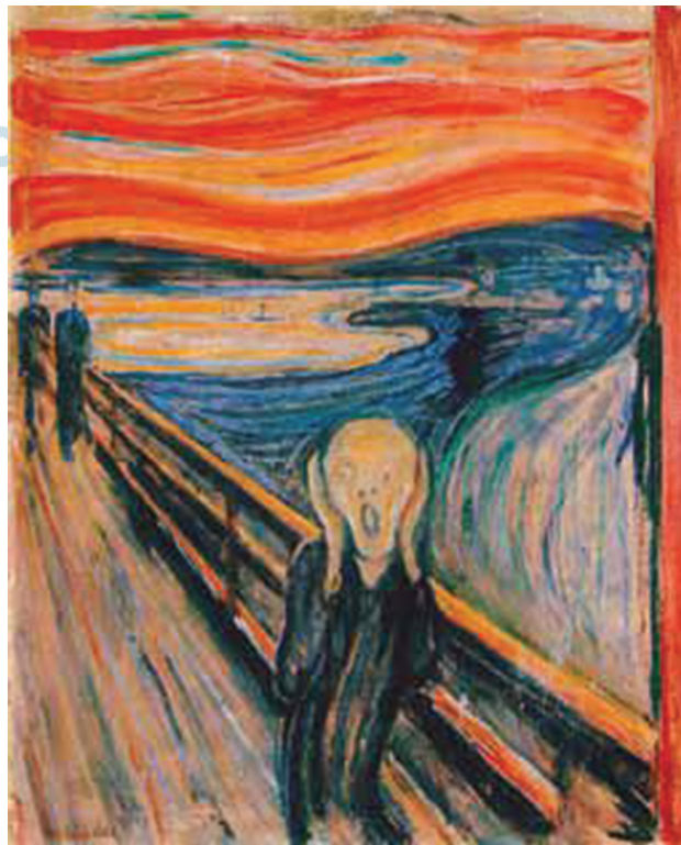
(Edvard Munch. O grito , 1893.)