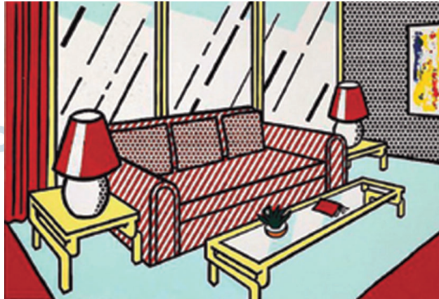
(Roy Lichtenstein. Luminárias vermelhas , 1990.)