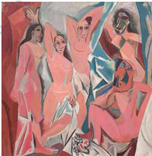
(Pablo Picasso. As senhoritas de Avignon , 1907.)