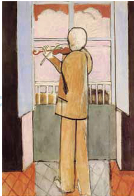
(Henri Matisse. Violinista à janela , 1917.)