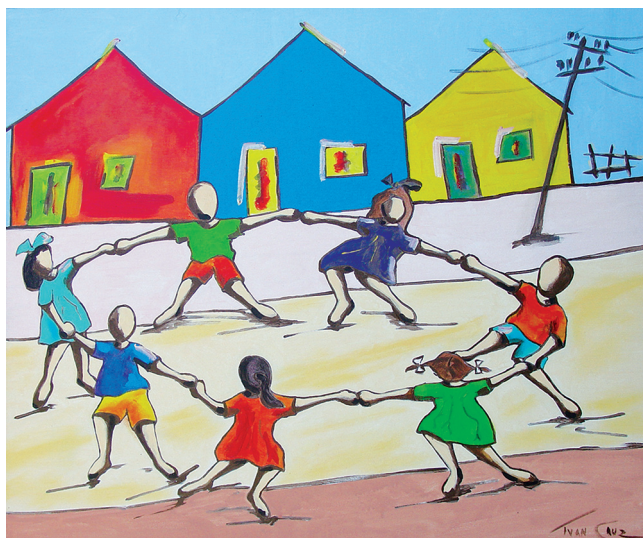
Ciranda II , 2018. Ivan Cruz.