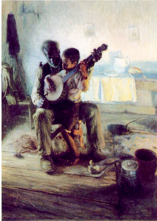
The Banjo Lesson, 1893. Henry Ossawa Tanner.