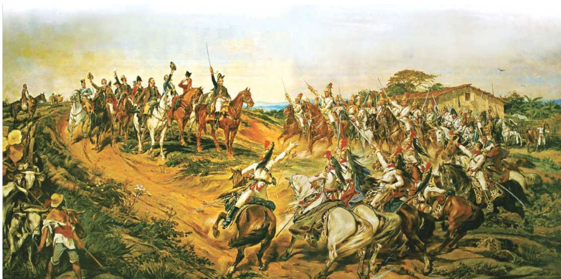
“O Grito do Ipiranga – Independência ou Morte” (1888) de Pedro Américo – óleo sobre tela; 760 x 415 cm Coleção Museu Paulista da USP

Observe a reprodução do famoso quadro de Pedro Américo e leia um trecho da análise que dele fez o escritor Raul Pompeia, em 1888.