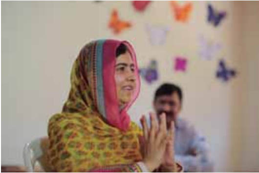
Nobel Peace Prize laureate Malala Yousafzai gestures inside a classroom at a school for Syrian refugee girls, July 12, 2015.

Sylvia Westall July 13, 2015 Bekaa Valley, Lebanon