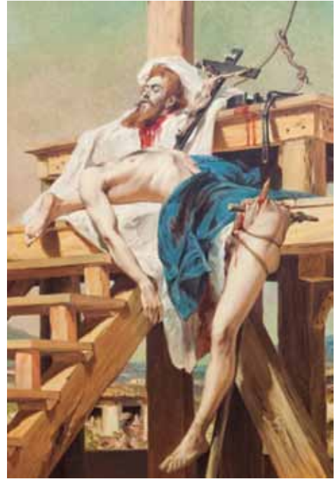
(Pedro Américo. Tiradentes esquartejado , 1893. Museu Mariano Procópio, Juiz de Fora.)

A conhecida pintura de Pedro Américo (1840-1905) remete a um fato histórico relacionado à seguinte escola literária brasileira: